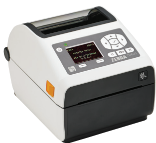
ZD620d-HC mit LCD

Als Gesundheitsdienstleister müssen Sie Ärzten und Pflegepersonal die Tools zur Verfügung stellen, die sie jeden Tag für eine optimale Gesundheitsversorgung benötigen. Der ZD620-HC von Zebra bietet mit seiner überragenden Druckqualität und hochmodernen Features weitaus mehr als herkömmliche Desktopdrucker. Der als Thermodirekt- und Thermotransfer-Modell erhältliche ZD620-HC bietet mehr Standardfunktionen als jeder andere Zebra-Desktopdrucker sowie ein optionales Bedienfeld mit zehn Tasten und LCD-Farbdisplay, das Druckereinstellung und Statusprüfung vereinfacht. Der speziell für den Einsatz im Gesundheitswesen entwickelte ZD620-HC ist desinfektionsmittelbeständig und verfügt über ein für medizinische Zwecke geeignetes Netzteil. Mit der optionalen Druckauflösung von 300 dpi werden selbst winzige Etiketten gestochen scharf und gut lesbar gedruckt. Der ZD620 nutzt Link-OS® und wird von unserer leistungsstarken Print DNA-Suite mit Anwendungen, Dienstprogrammen und Entwicklertools unterstützt, die durch bessere Performance, einfachere Fernverwaltbarkeit und unkomplizierte Integration für ein überzeugendes Druckerlebnis sorgt. Der ZD620 von Zebra bietet die Druckgeschwindigkeit, Druckqualität und Verwaltbarkeit, die Sie brauchen, um die Produktivität, Genauigkeit und Qualität bei der Pflege zu steigern.