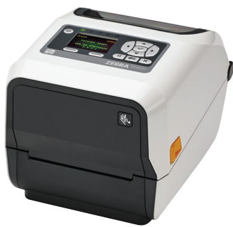
ZD620t-HC mit LCD